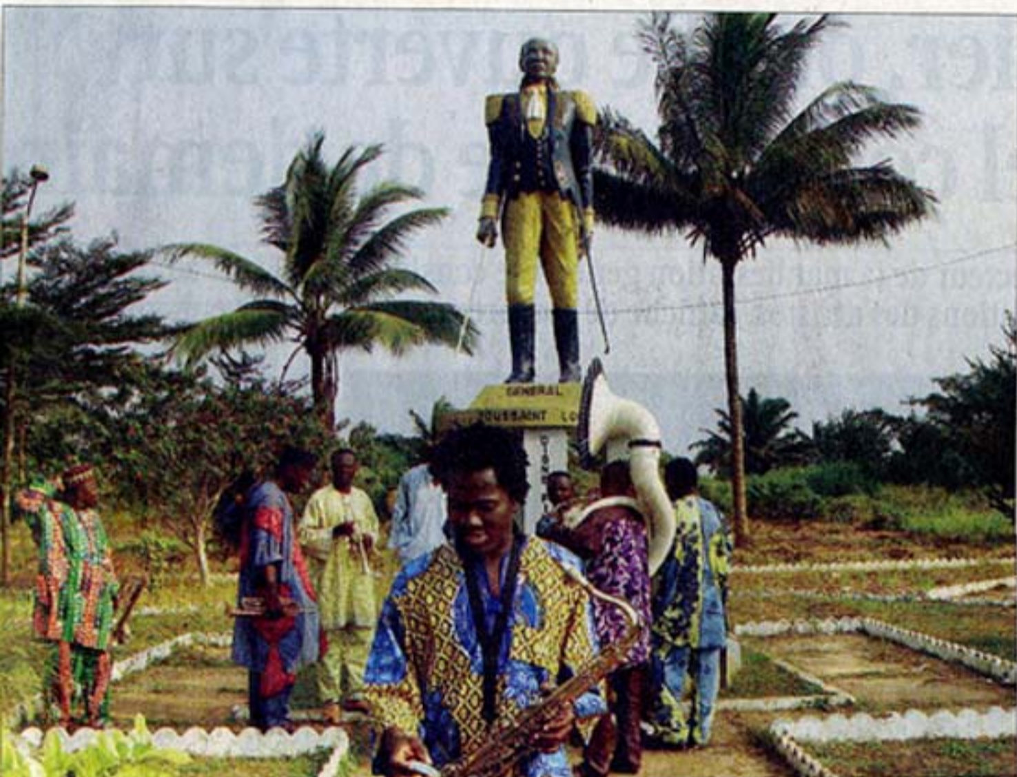
La fanfare, devant la statue de Toussaint Louverture. Le héros haïtien est une légende au Bénin. ALLADA, 2006